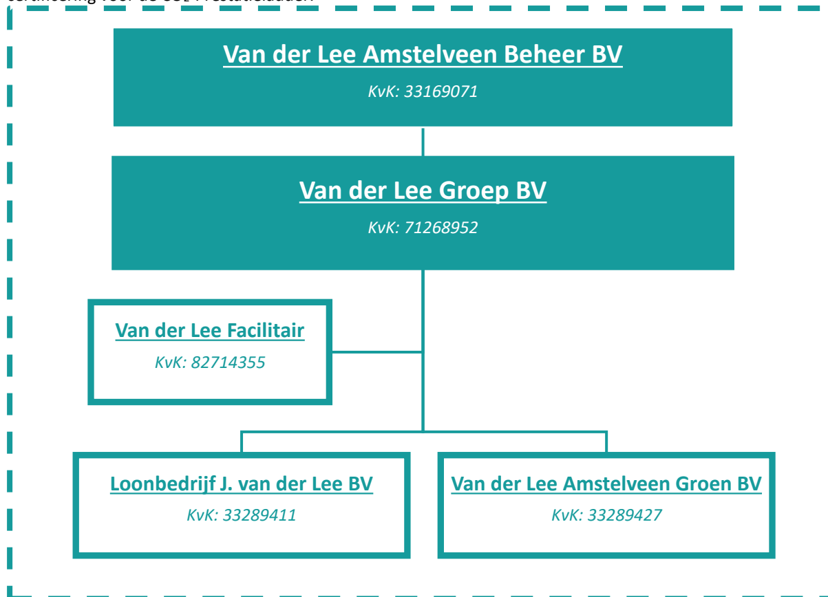
Figuur 1 - Organisatorische grens Van der Lee Amstelveen Beheer BV

Op basis van de beoordeling van de verbonden partijen kan geconcludeerd worden dat beide partijen binnen de organisatorische grens (aangegeven door de stippellijn) vallen, en dus binnen het aandachtsgebied voor de certificering voor de CO 2 -Prestatieladder.